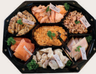
Luxe 7-vaks schotel